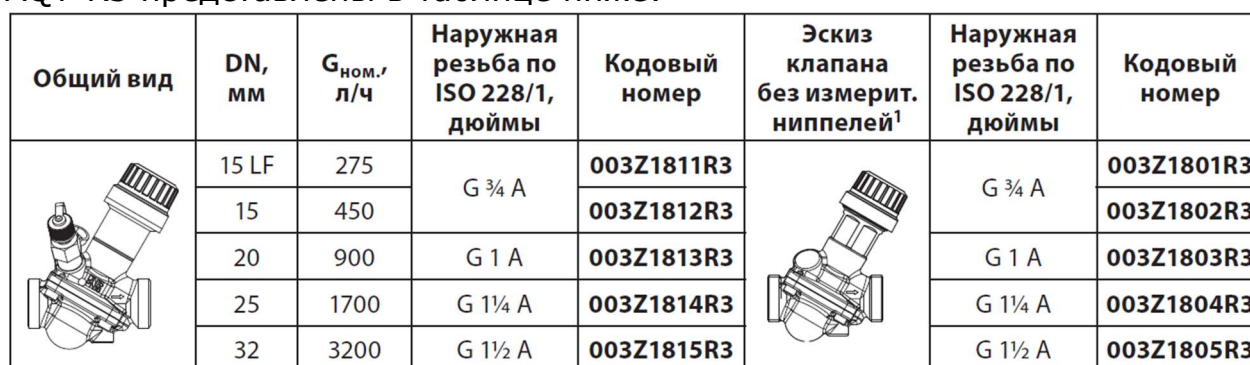
Таблица со значения расходов при различных настройках AQT-R3 приведена в Приложении 1.

Кодовые номера и значения номинальных расходов для клапанов AQT-R3 представлены в таблице ниже: