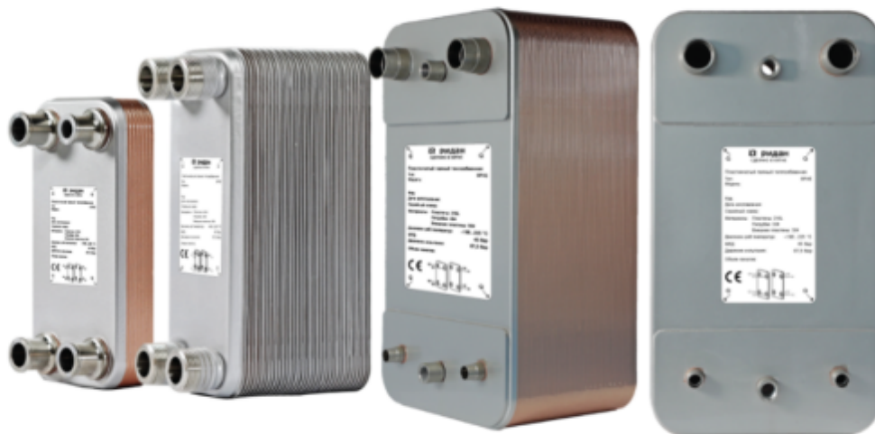
Рис.1 - Внешний вид теплообменников пластинчатых типа ВРНЕ

Теплообменники пластинчатые типа ВРНЕ предназначены для передачи тепловой энергии от одного теплоносителя к другому. Теплообменники пластинчатые типа ВРНЕ могут применяться в холодильных установках (компрессорных, абсорбционных), а также в тепловых насосах. В качестве рабочих сред могут использоваться негорючие хладагенты (фторуглеродороды, хлорфторуглеродороды, аммиак, СО 2 ), технические и холодильные масла, вода для технических нужд и систем ГВС, спиртосодержащие растворы.